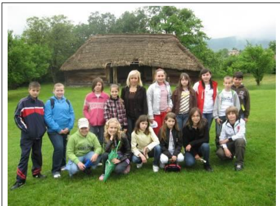
Ötödikesek a szentendrei skanzenben – 2010. május 12.