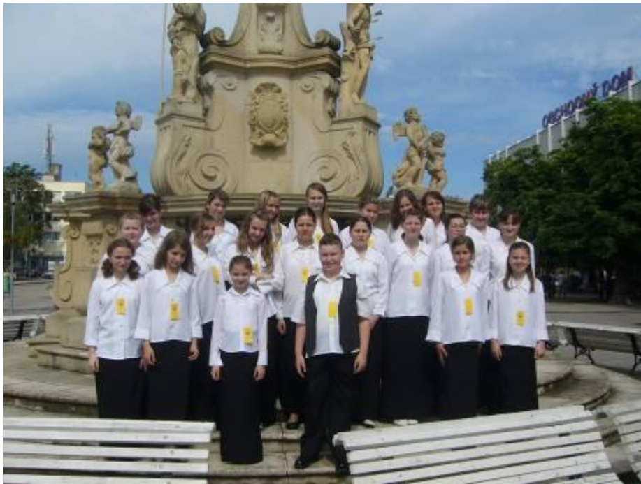
A Csalogány énekkar a Csengő Énekszó fesztiválon – 2010. május 29.