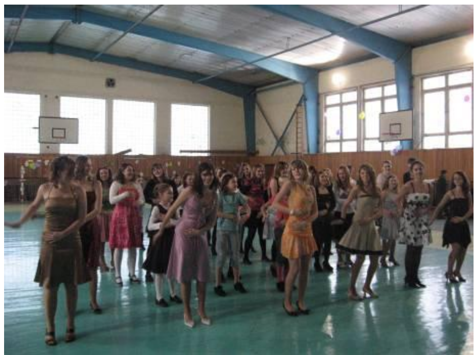
Vidám táncolás a farsangi diákbálon - 2010. február 5.