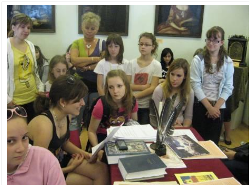
A dombóvári Helytörténeti Múzeumban – 2010. június 5.