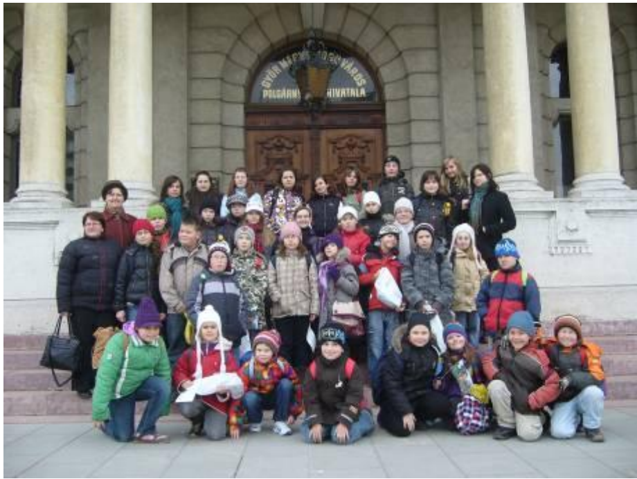
Napköziseink és a felfedezők Győrött – 2010. március 10.