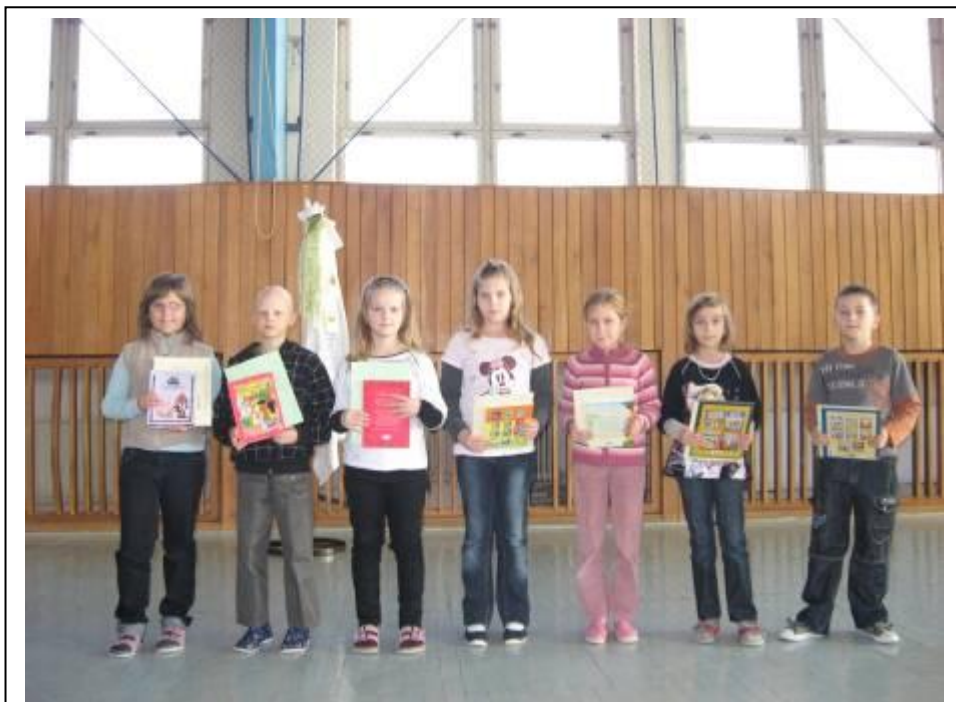
A VIII. Széchenyi-napok pályázatainak értékelése – 2009. október 22.