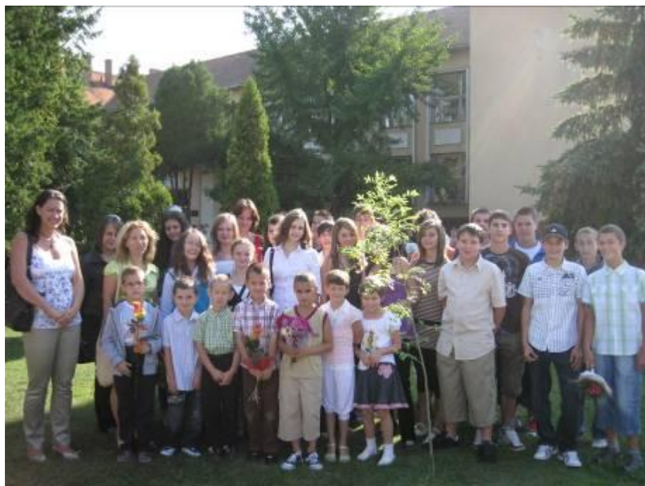
Kilencedikeseink és elsőseink a tanévnnyitón – 2009. szeptember 2.