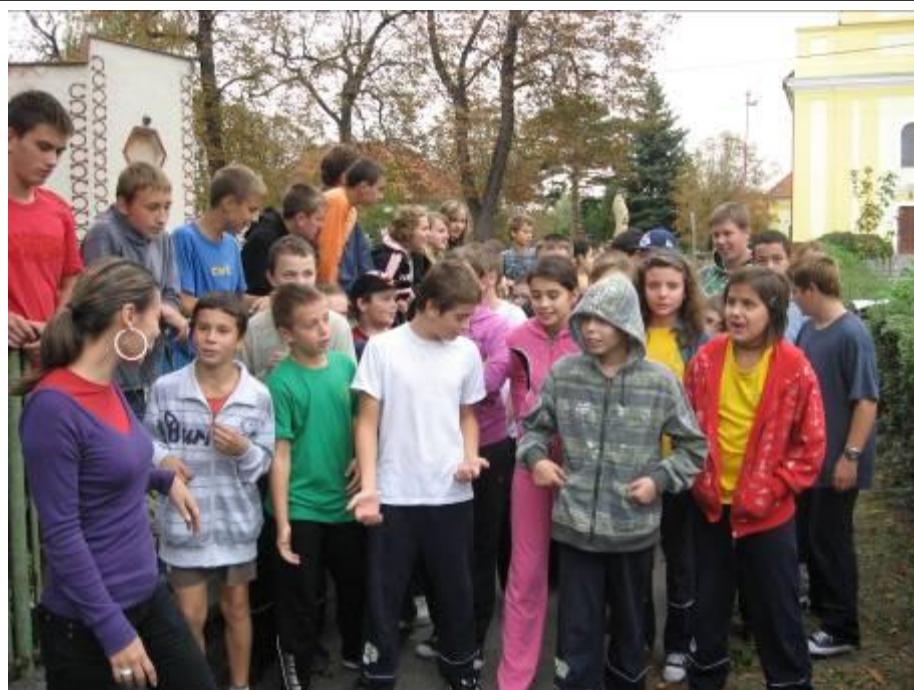
Hatodikosaink a rajt előtti pillanatokban – 2009. október 9.