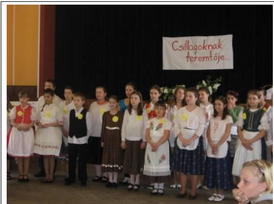
A „Csillagoknak teremtője...” verseny díjazottjai – 2010. május 4.