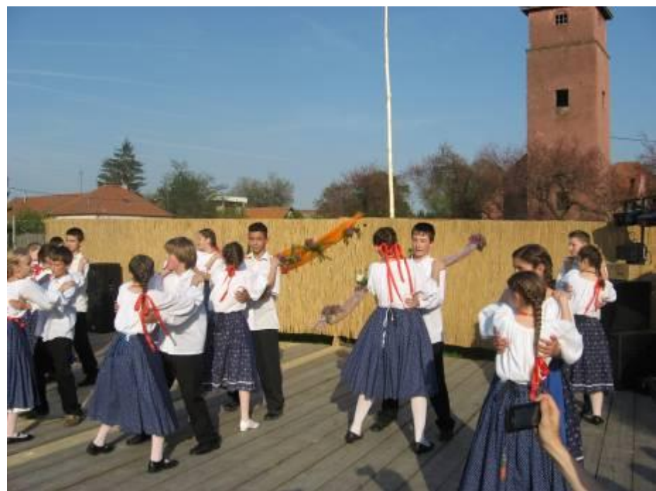
Táncosaink a májusfa-állítási ünnepségen – 2010. április 30.