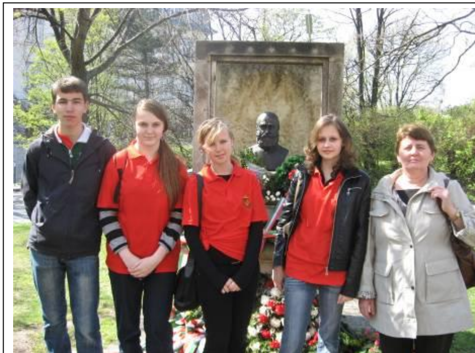
Tisztelgés Széchenyi nagysága előtt Döblingben – 2010. április 17.