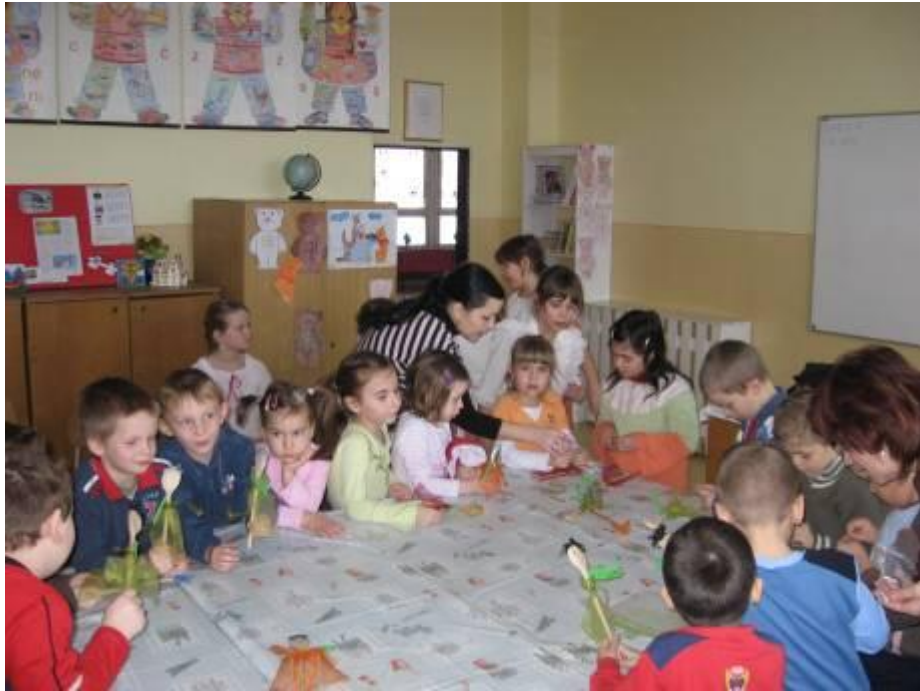
Bábut készítenek leendő elsőseink a beíratáson – 2010. február 3.