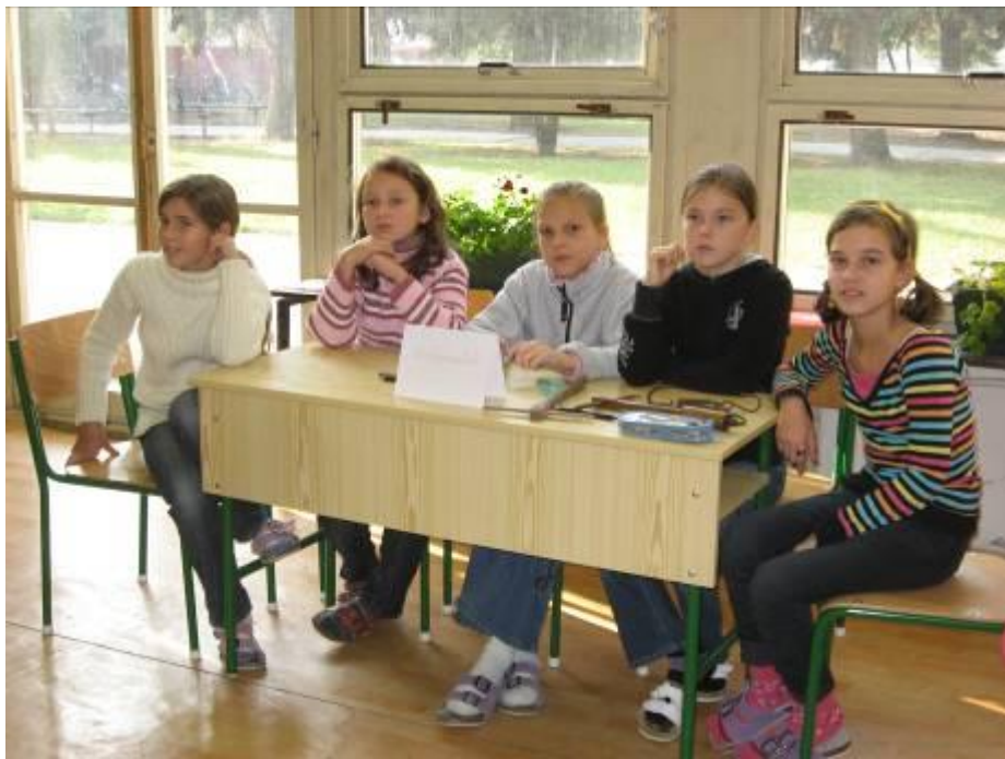
A Vadmacskák csapata a vetélkedőn – 2009. október 21.