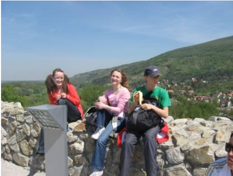
Pihennek kilencedikeseink a dévényi várfalon – 2010. április 29.