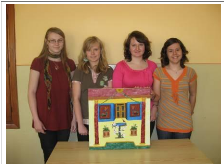
Történelmi freskó, készítőikkel – 2010. április 9.