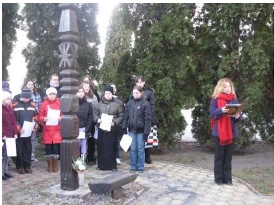
Emlékezés az 1848/49-es szabadságharcra – 2010. március 15.