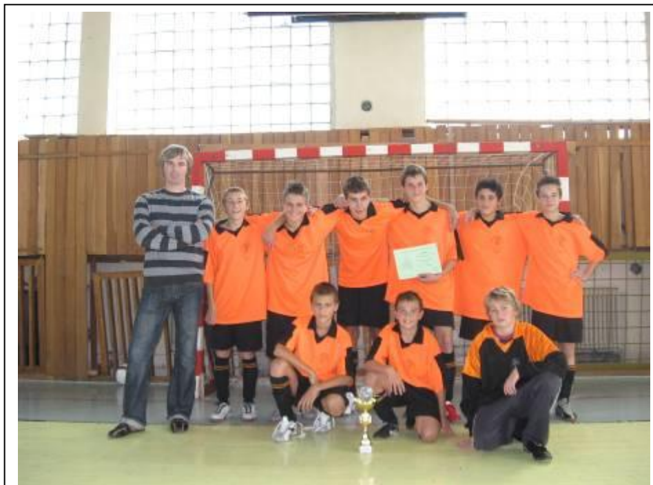
A Széchenyi-kupa győztes csapata – 2009. október 21.